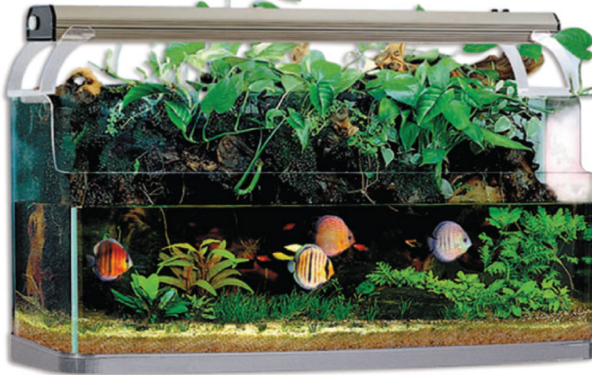
Палюдариум R 660