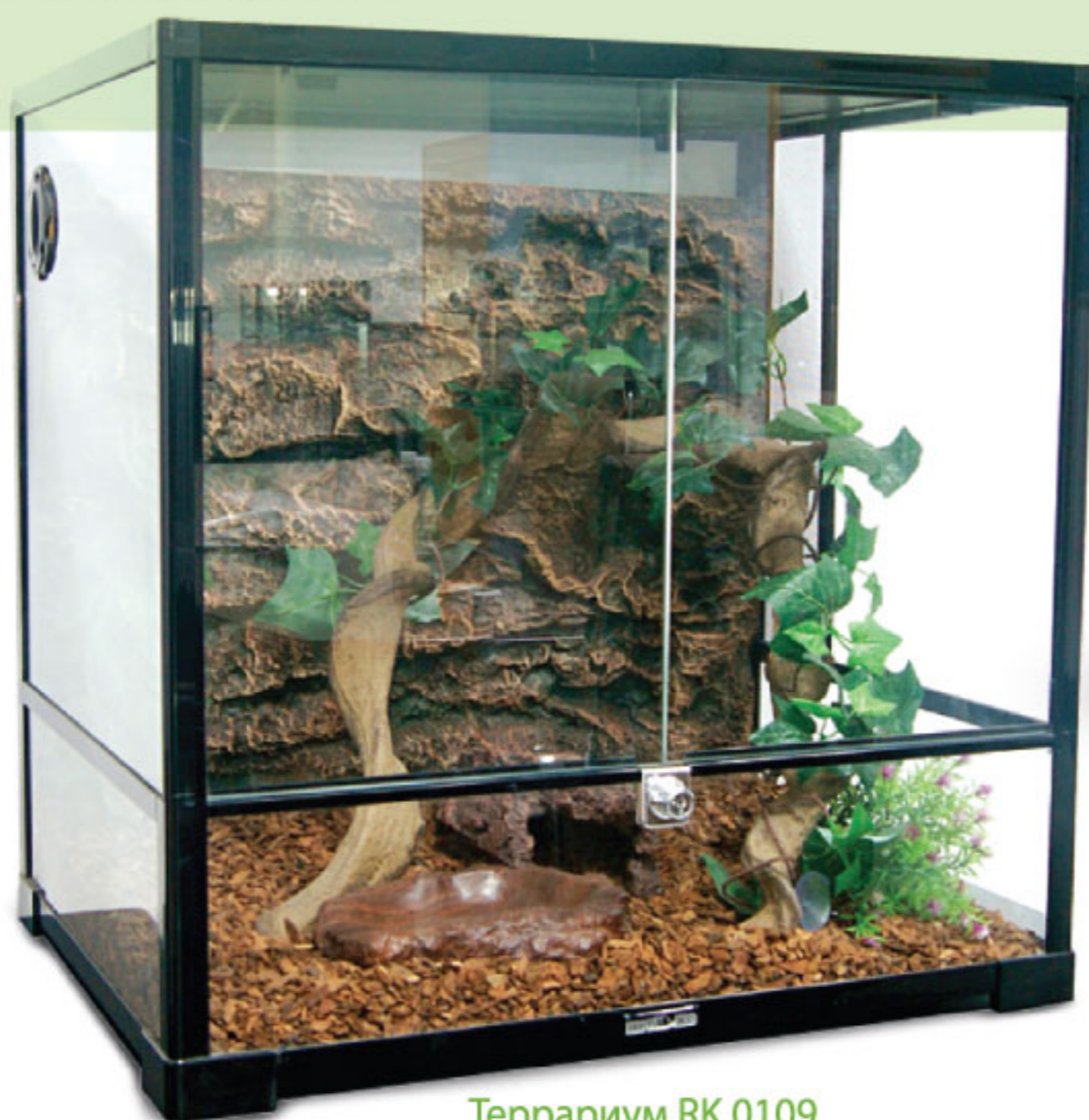
Террариум RK 0109