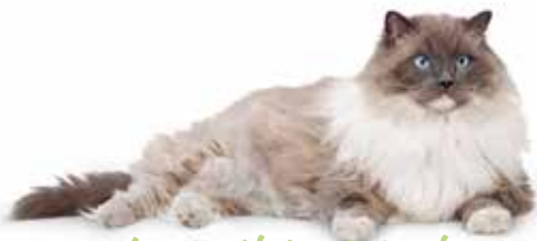
I'm Delighted Senior