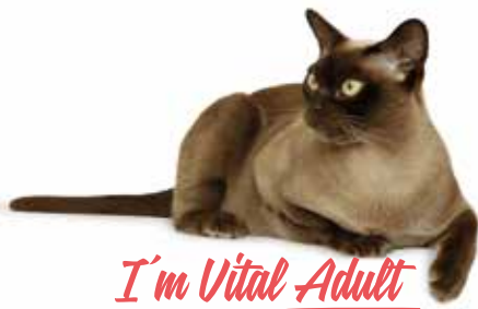
I'm Vital Adult